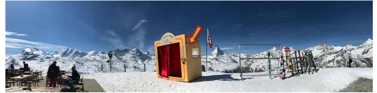
Sommet du Rotorn (3202m) pendant le Zermatt Unplugged